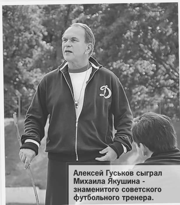
Алексей Гуськов сыграл Михаила Якушина - знаменитого советского футбольного тренера.