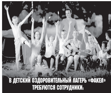
В ДЕТСКИЙ ОЗДОРОВИТЕЛЬНЫЙ ЛАГЕРЬ «ФАКЕЛ» ТРЕБУЮТСЯ СОТРУДНИКИ.

ПОВАРА - 3/П 30 000 РУБЛЕЙ ЗА СМЕНУ ОФИЦИАНТЫ - 3/П 25 000 РУБЛЕЙ ЗА СМЕНУ КУХОННЫЕ РАБОТНИКИ, УБОРЩИКИ - 3/П 20 000 РУБЛЕЙ ЗА СМЕНУ ГРУЗЧИК - 3/П 25 000 РУБЛЕЙ ЗА СМЕНУ