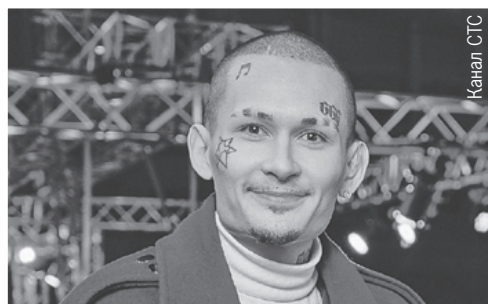
«РУССКИЙ НИНДЗЯ» По средам с 27 октября/20.00

Телеведущая шуточно добавляла, что в новой работе ее также привлекли герои шоу: