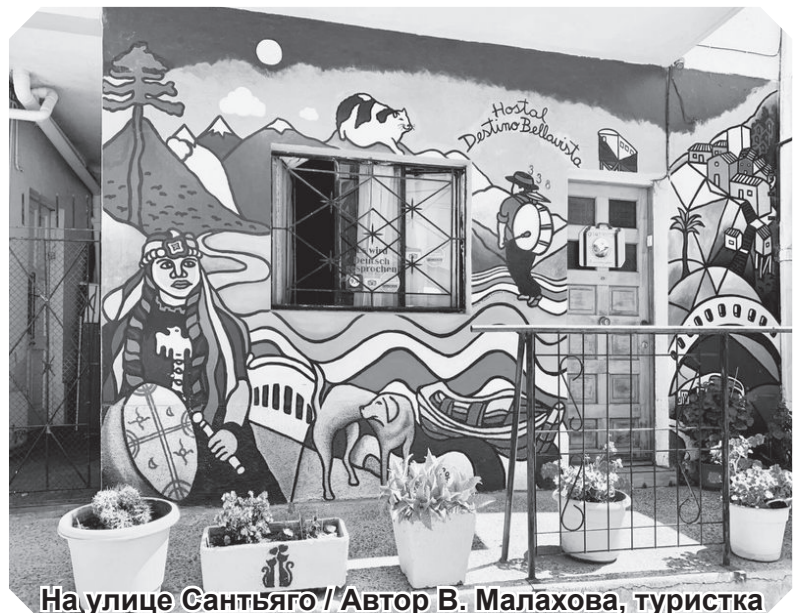
На улице Сантьяго