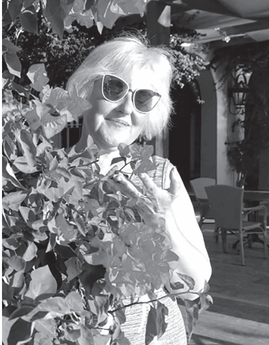
Дорогие читатели газеты «Авось-ка»!