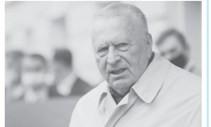
его жизни. Напомним, что по закону вступить в партию могут только достигшие 18-летнего возраста граждане.

ЦИФРЫ В Смоленской области – более 6000 членов ЛДПР. С 1 июля в ряды партии вступили более 200 человек. ЛДПР в регионе имеет большой авторитет. 6 депутатов представляют партию в Смоленской областной Думе. Более 100 депутатов работают в районах и сельских поселениях