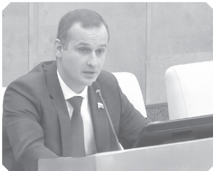
пресс - служба Смоленского реготделения ЛДПР

В части мер, которые были предприняты правительством касательно цен, министр пояснил, что самыми основными стали следующие: экспортная пошлина на зерно, квота на экспорт зерна, ограничение на экспорт риса, тарифные льготы на ввоз сахара и говядины, принятие 406 постановления, которое позволяет транспортировать зерно внутри страны, и зерновые интервенции.