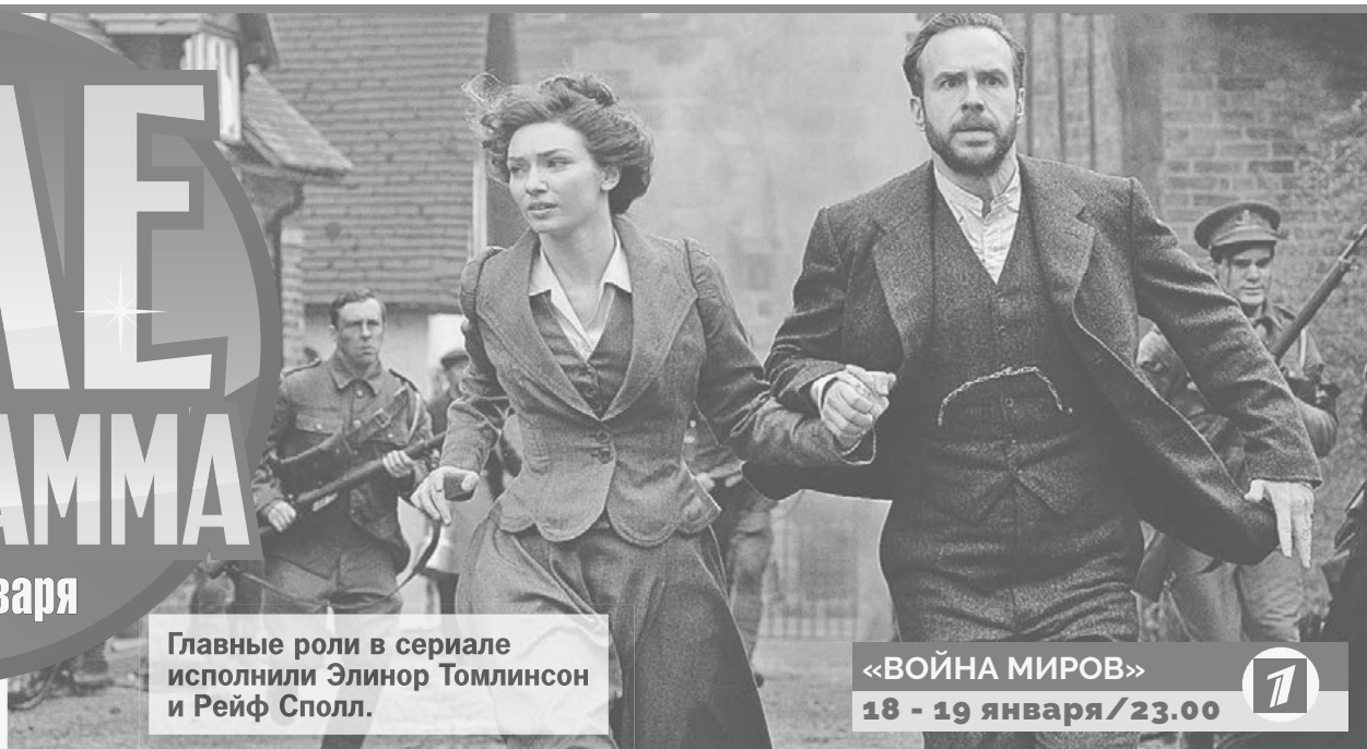
Главные роли в сериале исполнили Элинон Томлинсон и Рейф Сполл.