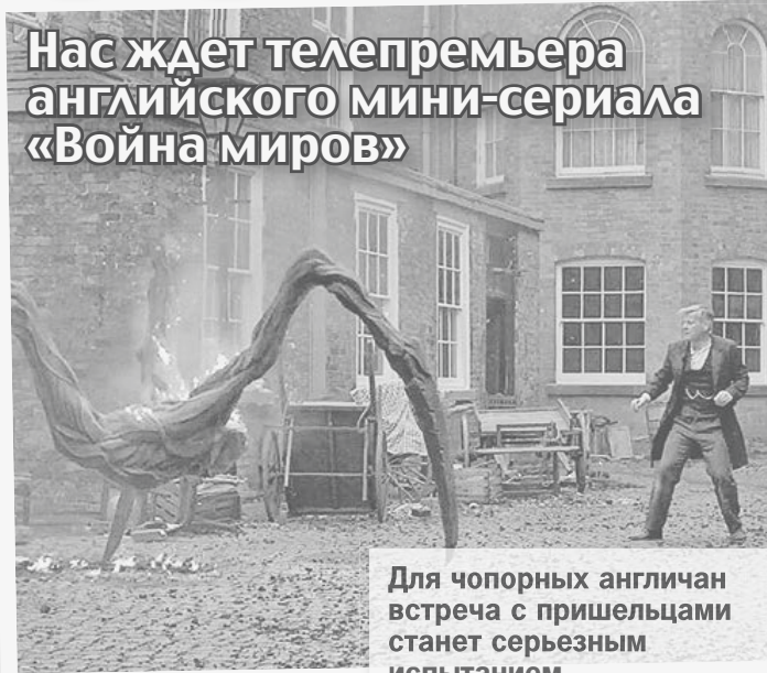
Для чопорных англичан встреча с пришельцами станет серьезным испытанием.

Нас ждет телепремьера английского мини-сериала «Война миров»